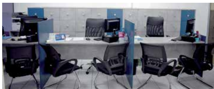
Sala departamento de benefícios

chado. “Mencionam sempre o bom gosto pelo novo layout, e como isto trouxe maior comodidade e conforto no atendimento. E a nós colaboradores, vejo hoje um local de trabalho agradável e funcional”.