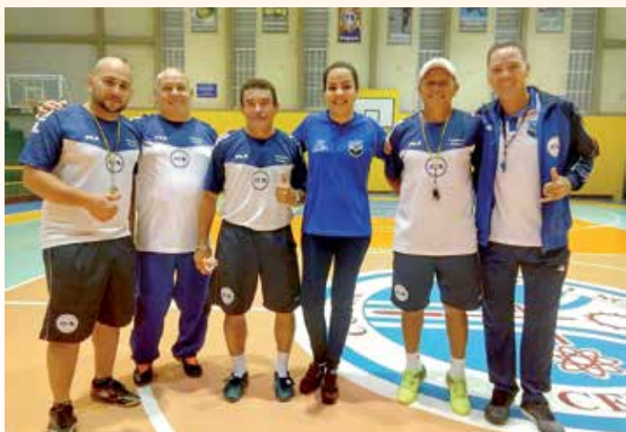
Equipe do futsal