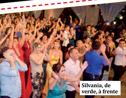
Silvania, de verde, à frente

soas da minha família e para mais quatro amigos. Gosto das mesas na pista”, diz.