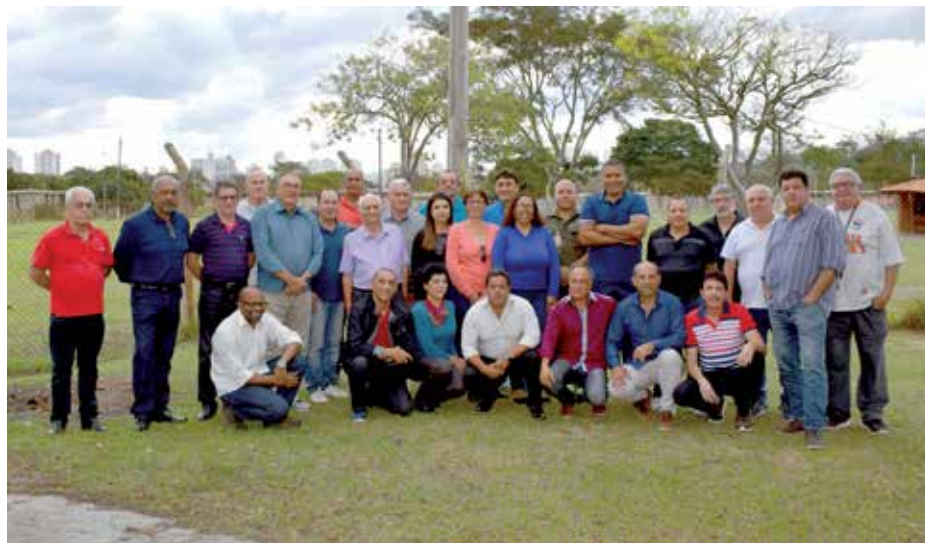
Conselheiros eleitos em 2017