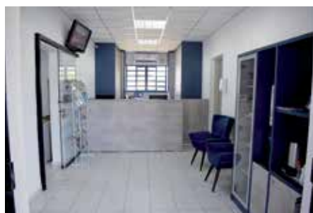
Recepção e secretaria