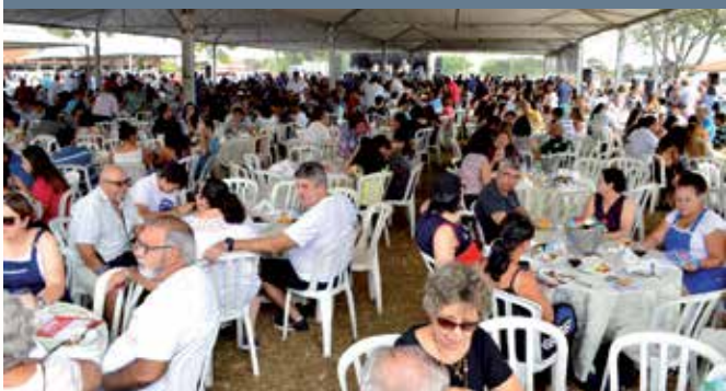
Aniversário da ADCCTA nas dependências do CSCT, que reuniu mais de 1.600 pessoas, em 2018

No fim, todos ganham, principalmente os sócios, que podem praticar ou participar de atividades de seu interesse em locais de fácil acesso, conforto e segurança.