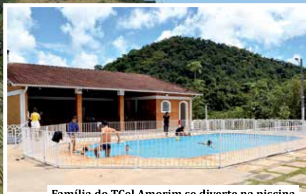
Família do Tcel Amorim se diverte na piscina