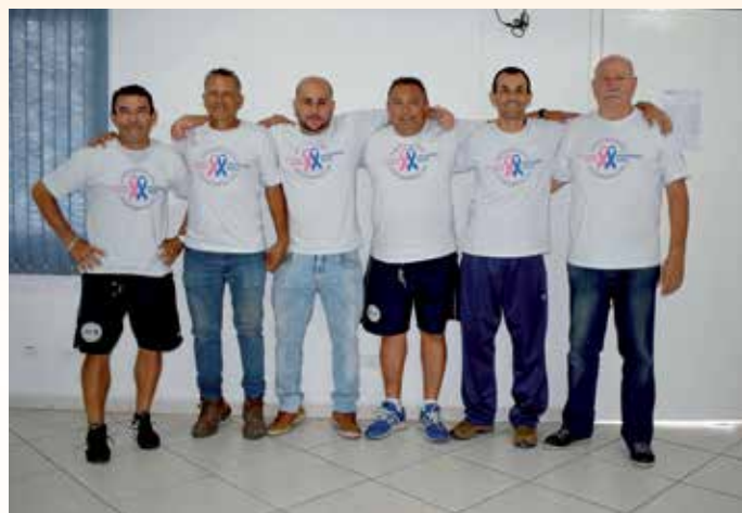
Professores do futebol de campo