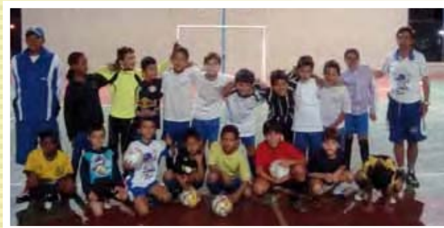
↘ ADCCTA cria a Escolinha de Futsal