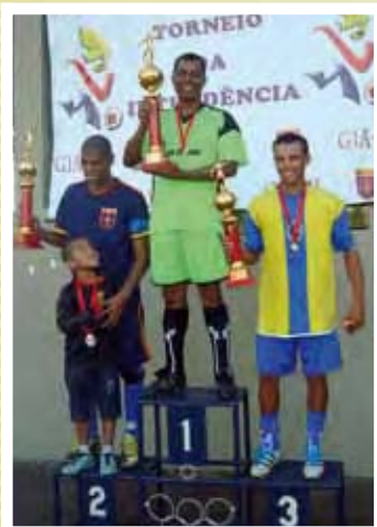
↘ ADCCTA apoia 1º Torneio de Futebol de Campo da Intendência do GIA-SJ