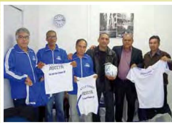
Entrega ↗ de novos uniformes e materiais esportivos para os Maratonistas e Escolinha de Futsal

Alguns locais, utilizados para aulas e treinos, receberam melhorias com a ajuda da ADC, como por exemplo, na troca de lona do tatame do CSS-SJ e na reforma da parte elétrica.