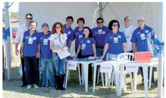
Equipe de assessores e funcionários recepcionam convidados para a grande festa