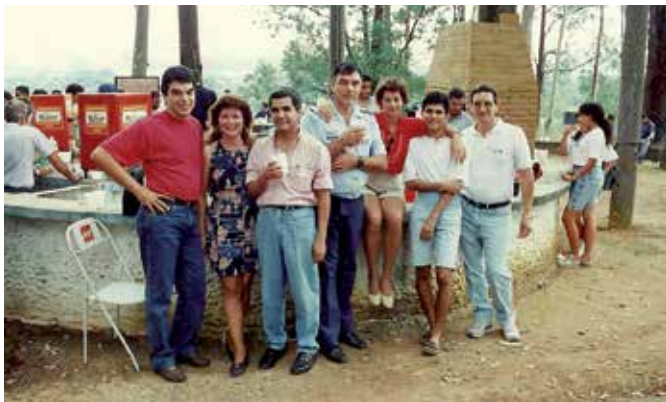
Churrasco para os sócios no Cocta