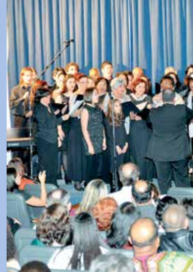
Comemoração dos 25 anos do Coral ADCCTA