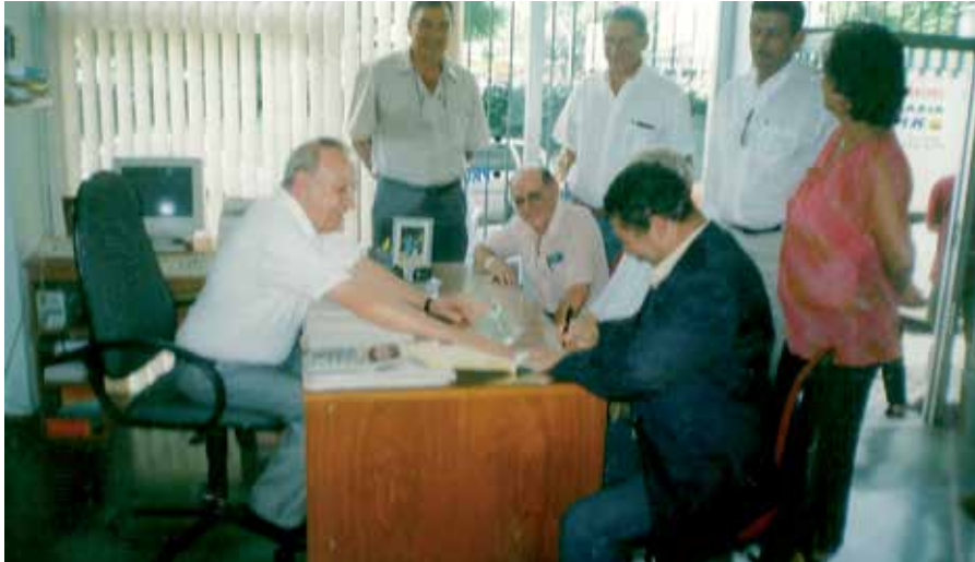
Assinatura da escritura do terreno da avenida Tívoli