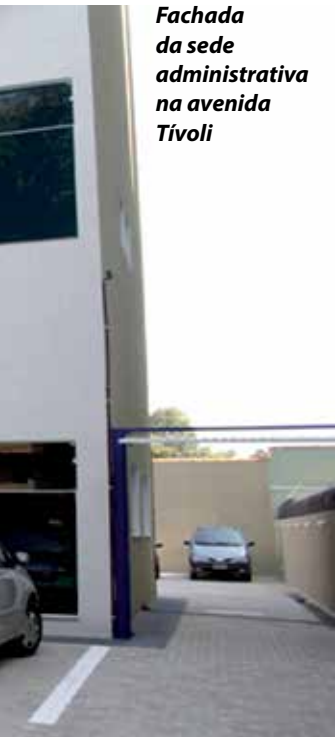
Fachada da sede administrativa na avenida Tívoli