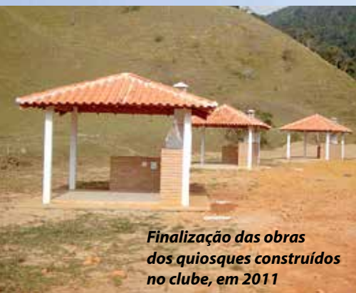
Finalização das obras dos quiosques construídos no clube, em 2011