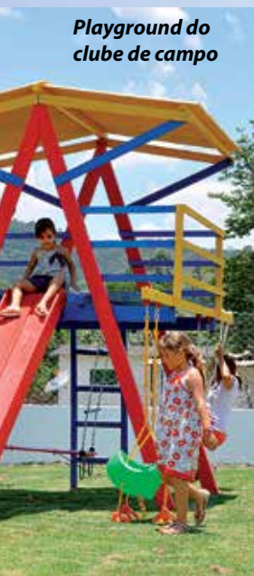
Playground do clube de campo

de diretores, assessores e conselheiros, são descerradas placas alusivas à inauguração oficial.