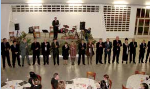
Posse da diretoria eleita para o triênio 2011/2014

Um churrasco marca a inauguração oficial do Clube de Campo da ADCCTA, na tarde do dia 7 de dezembro de 2012. Cerca de 400 sócios comparecem ao local para conhecer o clube e as benfeitorias nele realizadas no último ano, e, é claro, participar da festa de inauguração. Com espetinhos de churrasco, chope e refrigerantes, distribuídos à vontade, e animação da Banda Cheiro de Fulo, o público pode passar uma tarde agradável na sede campestre da ADCCTA. No final da manhã, numa pequena cerimônia, com a presença