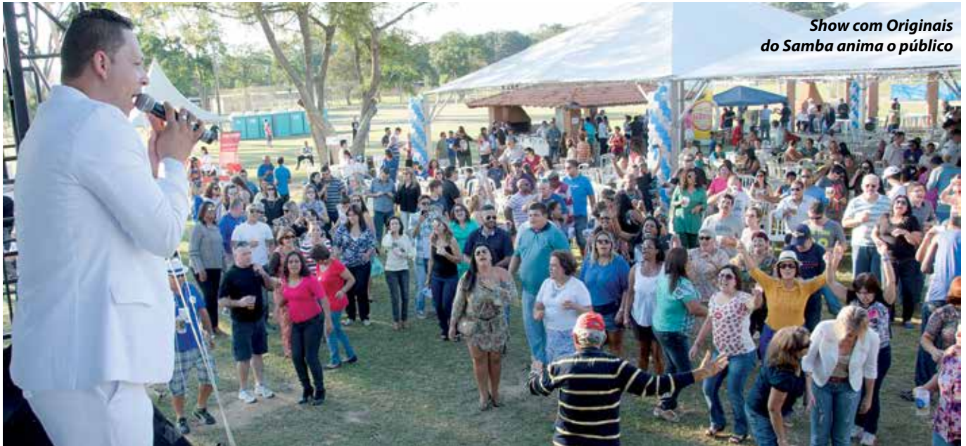
Show com Originais do Samba anima o público