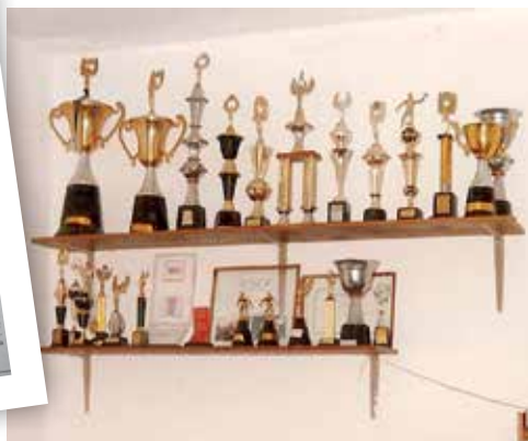
Troféus conquistados nos esportes

Os custos de manutenção são cobertos pela administração dos convênios médicos e odontológicos, seguros de vida, entre outros.