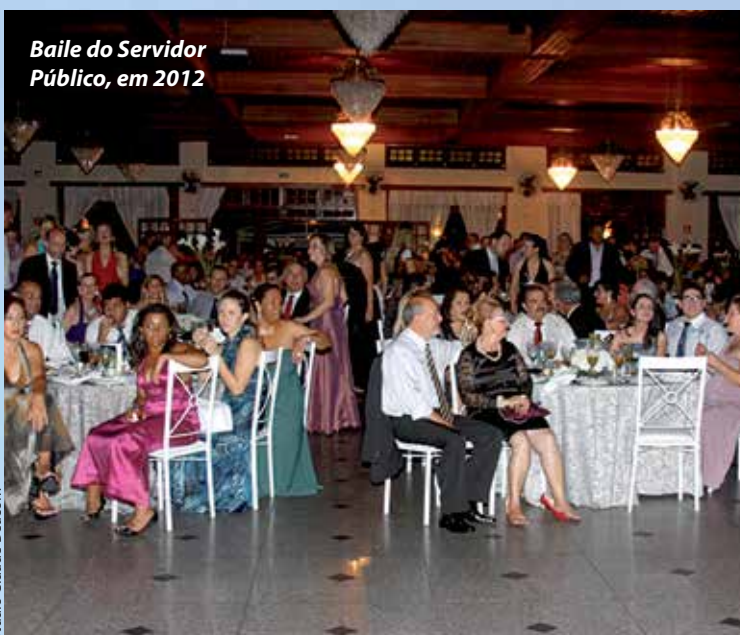
Baile do Servidor Público, em 2012