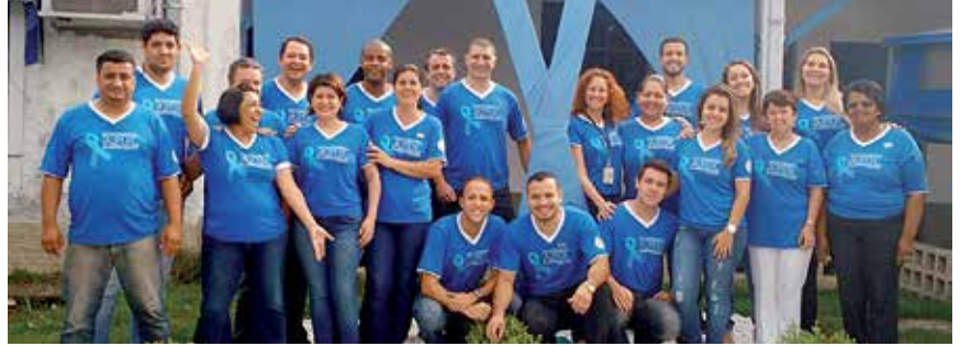
Funcionários na campanha Novembro Azul