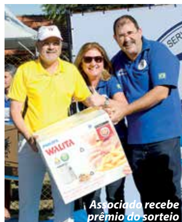
Associado recebe prêmio do sorteio